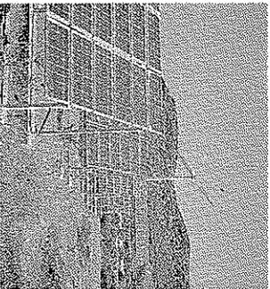
Pannelli solari e pale eoliche

SASSARI. La Asl informa che, a partire da oggi, è stato attivato il sistema di notifica automatica tramite posta elettronica dell'avvenuta emissione degli ordinativi di pagamento a favore dei fornitori di beni e servizi. I fornitori che ancora non avessero indicato il loro indirizzo email sulle fatture, possono comunicare a servizio.bilancio@asssassari.it.